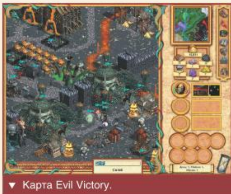
▼ Карта Evil Victory.

Сегодня у нас настоящий аншлаг — вас ждут не дожуды целых восемнадцать самых интересных карт. Ну а самой лучшей мы считаем карту Evil Victory , на которой вам предстоит перейти на сторону Лорда Тьмы, явившегося к нам в гости прямо от дьявола и жаждущего захватить все окрестные земли. Вам выпал прекрасный шанс установить новый порядок в этом мире. Кроме того, вас ждут карты «Жадность», «Город спорта и игр», Around the Calendar , Deathmatch , Dimensions , Eva , Fall of Capital , Fyndareal , King Ruprecht Attacks , Kuzepn , Learn to Conquer , Life on the Volcano , Mage Wars , Nata's Crazy Land , Nine Schools , Prout Nanere , Who First .