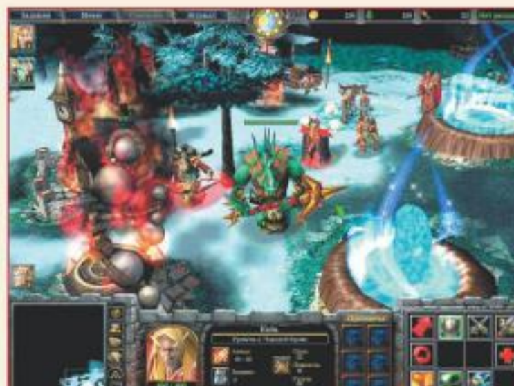
▼ Карта Lich King

Кроме того, вас ждут карты « Проклятье », Capture the Flag , Donjons Dragons , Isle of Death , JailBreak Code Red , Open Rpg Islands , Relentless , Snipers Territory , The Big Road , The Legend of Forgotten Holy War , The Minotaur и отменная кампания Tactics Unleashed .