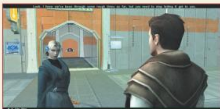
▼ Модификация Mind Probe.

Также вас ждут модификации: Dual Weapon Wield позволяет вам носить двуручное оружие в одной руке, Fully Item Creation значительно расширяет список доступных для создания предметов, Hardcore повышает уровень противников, Male Head Reskin изменяет внешний вид одной из доступных игрок моделей, Mandalore Bloodstained дает возможность щеголять в заляпанной кровью мандалорской броне, PCB позволяет таскать с собой раскладной рабочий столик, Sarmorre дает возможность нарядить своих подопечных в модную броню, Slave Leia поможет одеть любую девушку в костюм принцессы Леи при дворе Джаббы, Visas Dark изменяет внешний вид девушки по имени Висас, а Grenades увеличивает повреждения от гранат за счет скилла персонажа Demolitions.